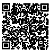
แบบฟอร์มการขอรับการพิจารณาจริยธรรมฯ